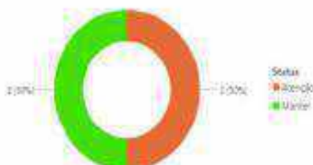
Contagem de Escolas por Status