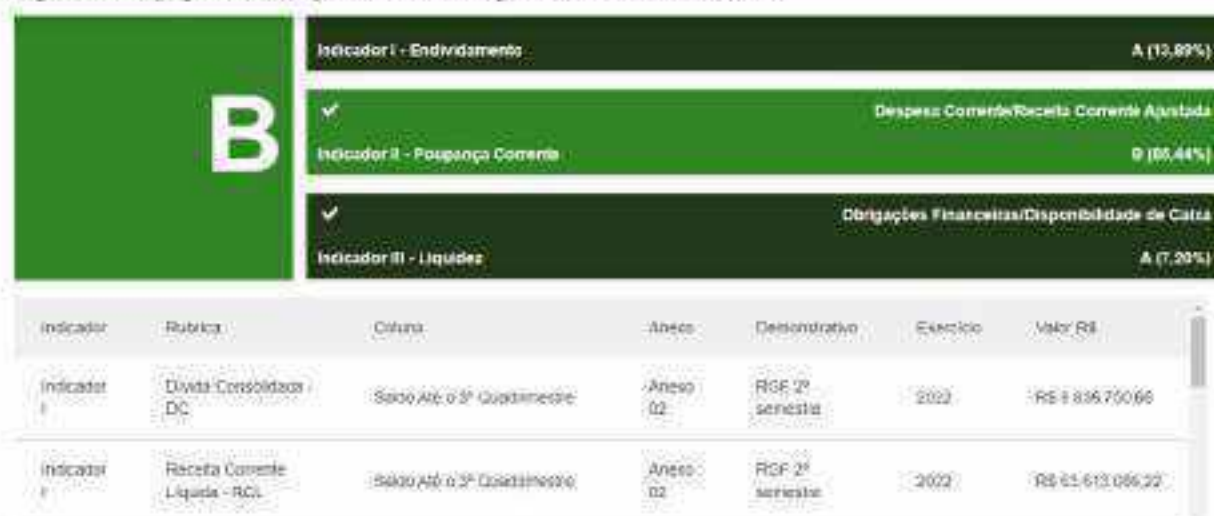
Figura 3 - Capag do Município de Monte Negro 2023 – ano-base 2022